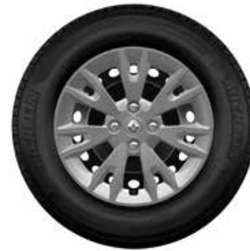
Embellecedor Eptius 15''