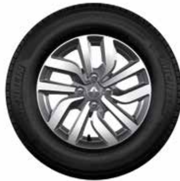
Rin de aluminio Premia 15" diamantado

Todas las imágenes son de referencia. Las especificaciones varían según la versión del vehículo comercializada.