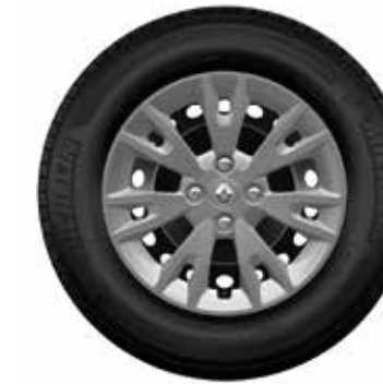
Embellecedor Eptius 15''

Todas las imágenes son de referencia. Las especificaciones varían según la versión del vehículo comercializada. *Se requiere el uso de un cable original del celular. Los cargos por el uso de internet y datos móviles son asumidos por el cliente.